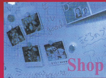
商店告示板、顧客留言