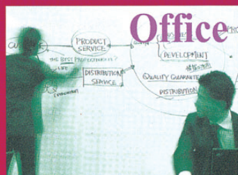
任何空間都能變身會議室