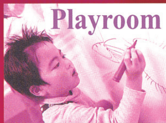
給孩子創意、隨意的塗鴉牆